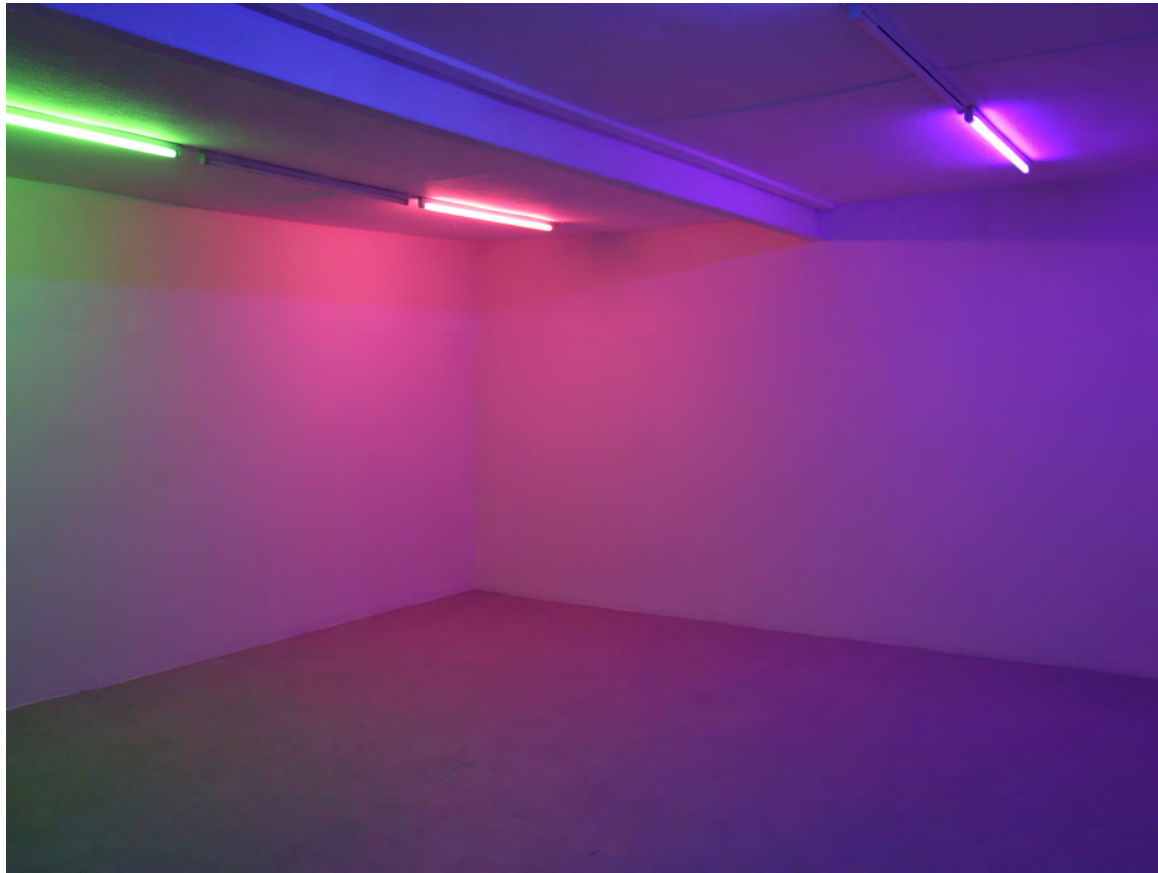
Chroma 2018, Farbige Leuchtstoffröhren, farbige Folien Adhoc Raum, Bochum