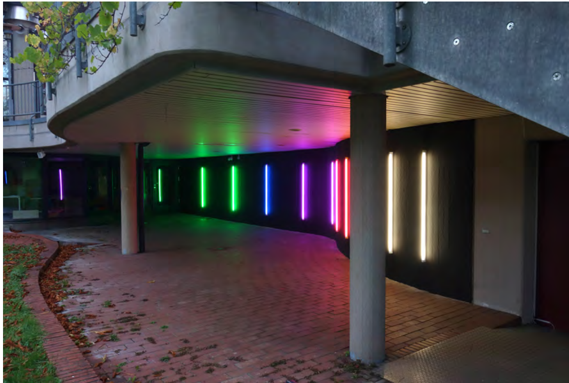
Wave 2017, farbige Leuchtstoffröhren, Acryl auf Wand Faulerbad, Freiburg