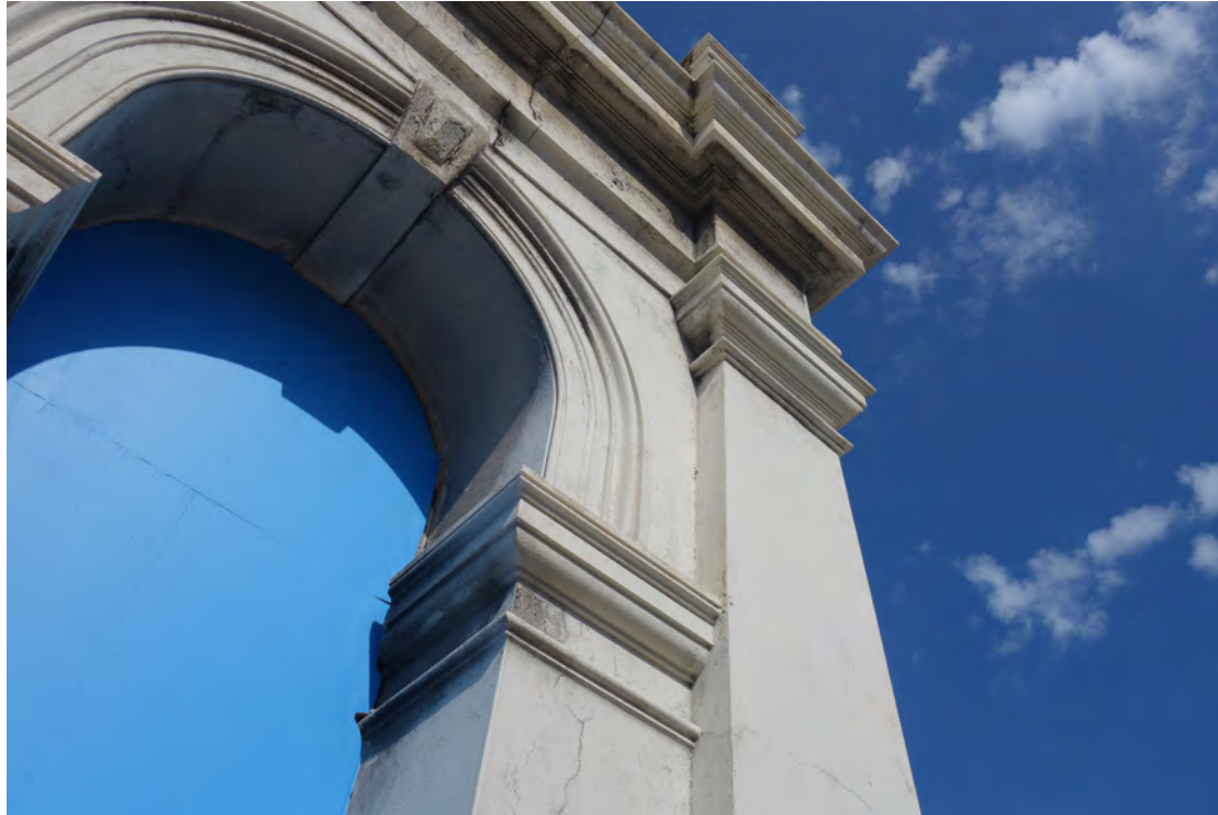
Arcade 2017, MDF, Acryl, historische Fassade High Tide, Fremantle Biennale, Australien