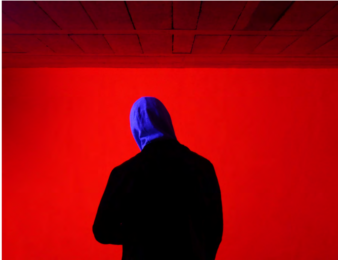
Red 2018, Acryl auf Wand, Schwarzlicht Open Garage, Karlsruhe