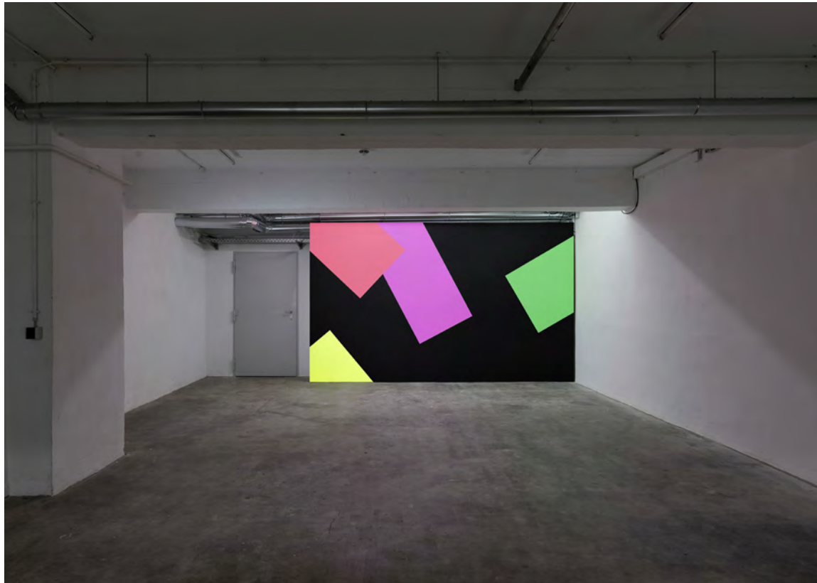
Shop 2017, Acryl auf Wand, 2,4 x 4 m Van Look Preis, Galerie für Gegenwartskunst, E-Werk, Freiburg