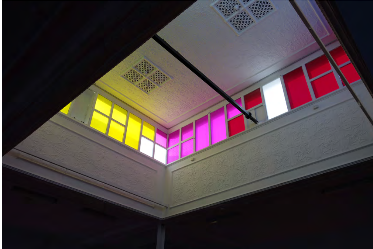
Skylight 2018, Farbige Folie auf Fenster High Visions, Artsource, Australien