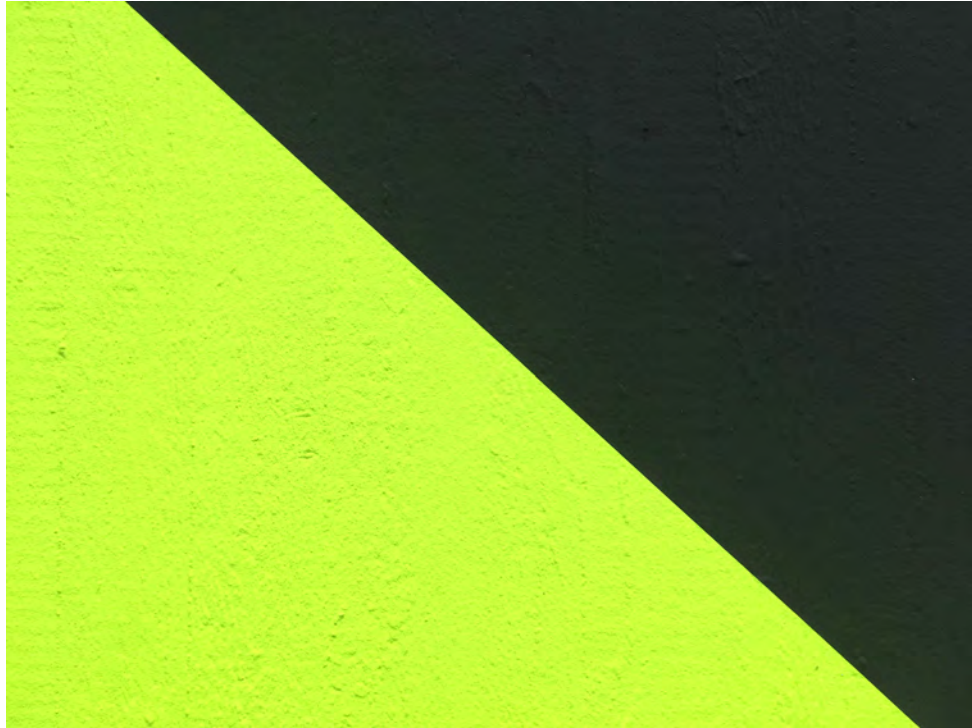
Skipper 2018, Acryl auf Wand, 2,2 x 12,5 m Faulerbad, Freiburg