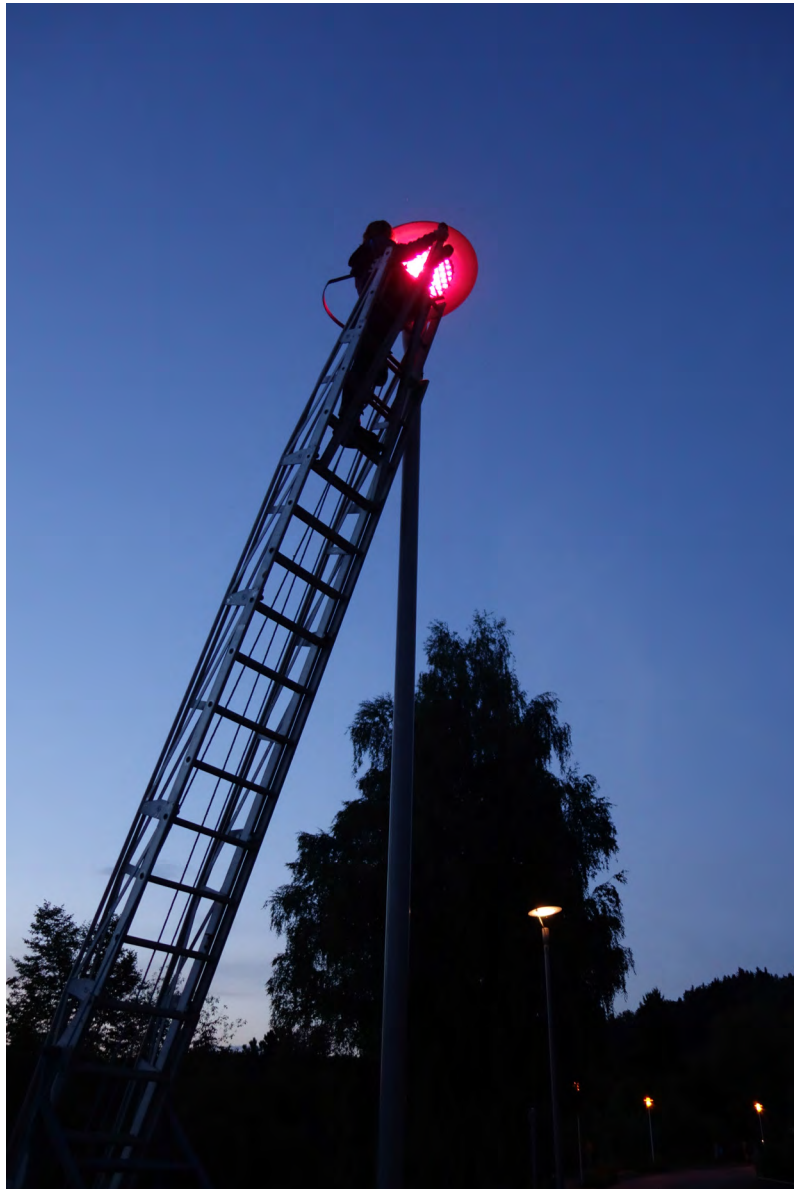
Border Lights 2017, farbige Folien, Strassenbeleuchtung Wernstein, Österreich